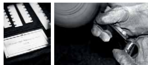
Более 30 различных групп специалистов принимают участие в производстве сейфа Стокингер.