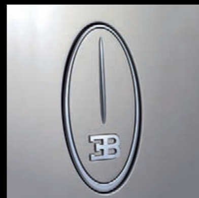
Эллипс дверной ручки выдвигается и задвигается автоматически