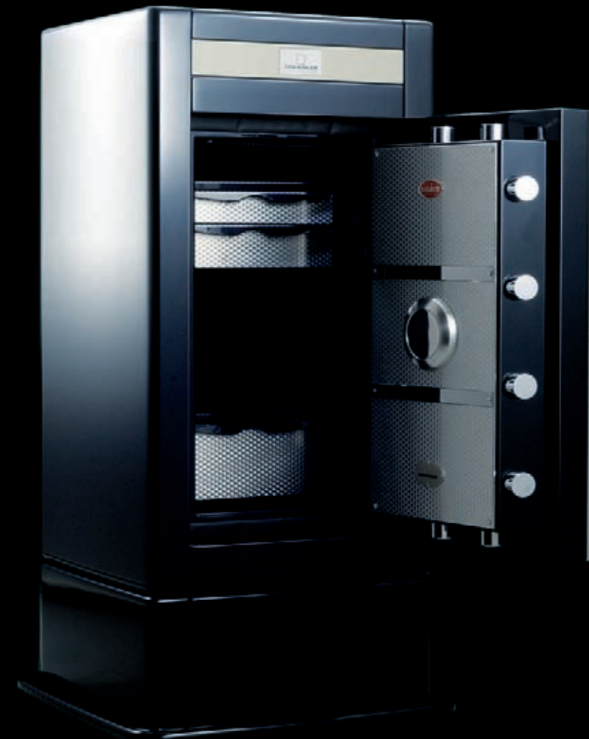
Эллипс дверной ручки выдвигается и задвигается автоматически